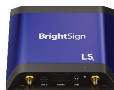
4K Basic I/O Package