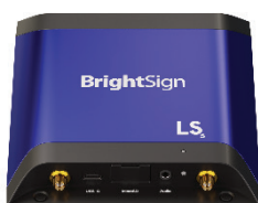
HD Basic I/O Package